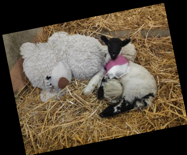
Prvi dan druga kravca 😊