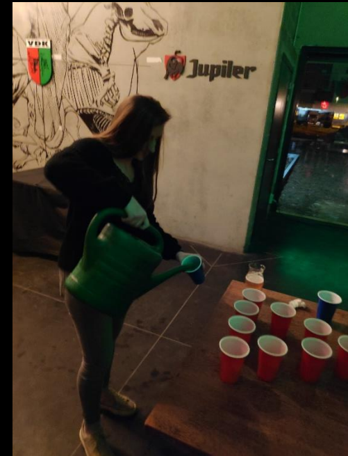
Točenje piva za študentski beerpong