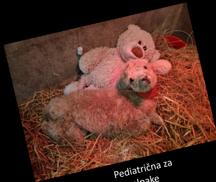
Pediatrična za alpake