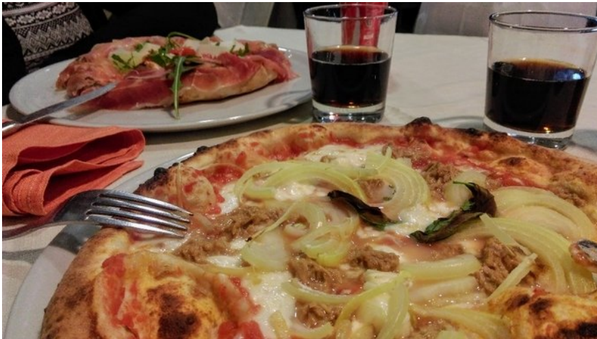
Univerza v Ljubljani