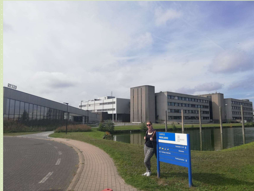
Univerza v Ljubljani