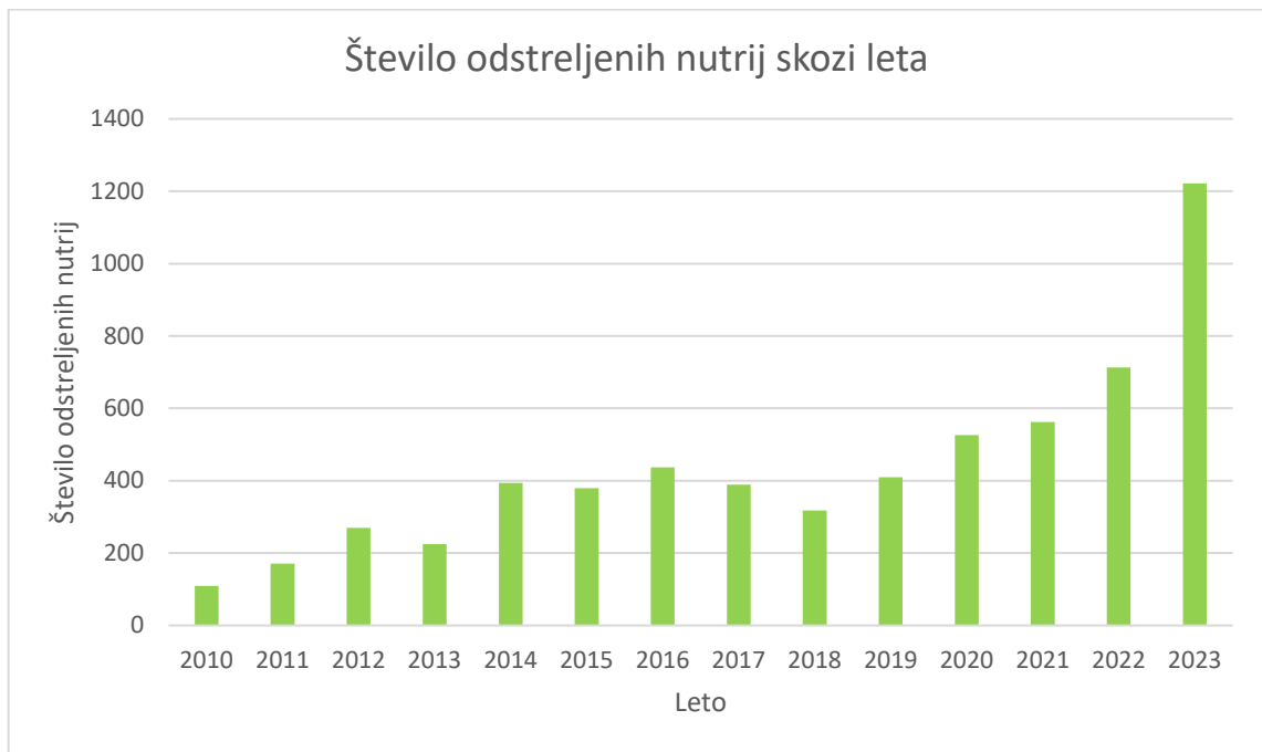
Slika 3: Število odstreljenih nutrij skozi leta v Sloveniji (32).