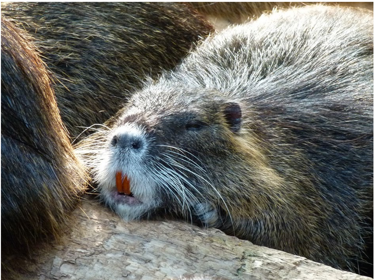
Slika 2: Nutrija ( Myocastor coypus ) (19).

Med zgoraj naštetimi živalmi še posebej izstopa nutrija, ki je zaradi svojih značilnosti in vpliva na okolje trenutno pomemben predmet raziskav in ukrepov.